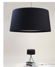
GT1000 / GT1500