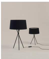
Trípode G6 / M3