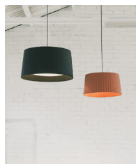
GT5 / GT6